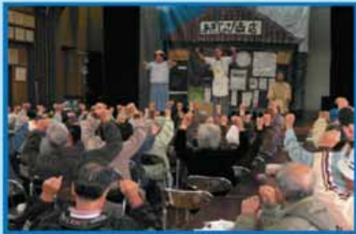
参加者と一緒に「あぎじゃび体操」(大里字大城公民館)

今回の還元事業は、県内の(有)FECオフィスによる喜劇「あぎじゃび商店」を5ヶ所で披露、300名余の参加者が元気パワーを頂きました。