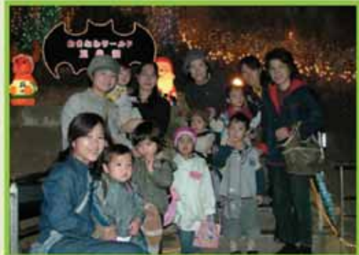
おきなわワールド文化王国・玉泉洞

12月14日、おきなわワールド文化王国・玉泉洞で、ママ's Cafeの遠足が行われ、20名の親子が参加をしました。本会では、日頃在宅で、子育て奮闘中のお母さんに、お家から一歩外へ出かけてもらい、心のリフレッシュや子育てについての情報交換並びにネットワークづくりを目的に子育て支援事業「ママ's Cafe」、おもちゃ図書館・かたぐるまを取り組んでおり、今回は、「親子で近隣の施設におでかけ」ということで、おきなわワールド文化王国の協力を得て実施。参加した親子は、「楽しいひと時が過ごせました。」と感想を述べていました。