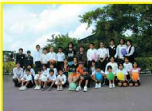
百名小学校、玉城小学校、船越小学校

12月3日、おきなわワールド文化王国・玉泉洞で、玉城の3小学校児童30名が、観光客らに募金協力の呼び掛けを行い、街頭募金活動を行いました。参加した児童は、「一生懸命呼び掛けたら、協力して下さる方がたくさんいたので、優しさや思いやりの心を持っている人は、たくさんいるだなと思い、とても嬉しくなった。」と話していました。