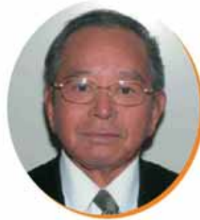
会長 助 徳 客 理 勢

関係機関、各種団体、市民の皆様のご指導とご支援によるものと深く感謝を申し上げます。