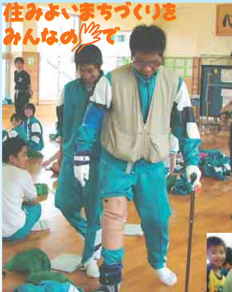
▲ 疑似体験をする 大里中学校 3年生

市内の小中学校では「総合的な学習の時間」の中で「福祉」をテーマに様々な活動に取り組んでいます。