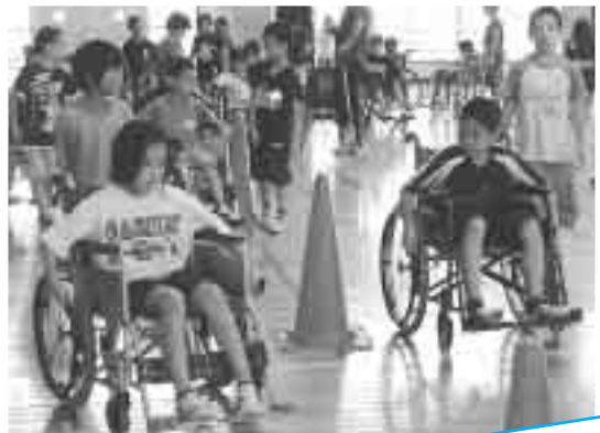
▲ 佐敷小 車いす体験より

また、「これから、みんなのためにボランティアをしたいと思います。まずは、ゴミ拾いやさまざまな人のために勉強をしたいと思います。」「この体験をして世界中の人々が安全で安心して暮らせるまちにしたいと思いました。」と感想もあり、福祉体験学習が誰もがすみよいまちにしていくために自分はどうすればよいかと考えるきっかけづくりになり、子どもたちは自分たちが住む佐敷に思いをめぐらせることができました。