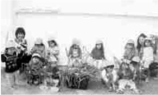
みんなで収穫したたまねぎ、どんな味がするのかなあー

小羊保育園では、「思いやりのある子」「あいさつのできる子」「落ち着いて人の話が聞ける子」を保育目標に掲げ、進級、卒園をする頃には目標が達成出来るように日々の保育を行っています。