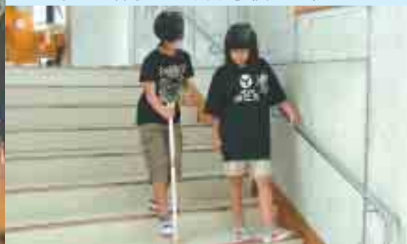
▲ アイマスク体験 佐敷小学校 4年生