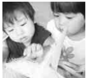
きいろいつぶつぶからおひげがのびてるよー

〒901-0608 南城市玉城字親慶原749番地2 TEL (098) 948-7211