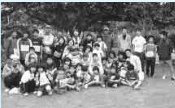
▲総勢42名参加で盛り上がった視覚障害者マラソン

社会福祉法人 豊友会「島添の丘」 〒901-1202 沖縄県南城市大里字大里2300番地 TEL 098-946-3331 FAX 098-946-3332 E-mail shimazonooka@star.ocn.jp