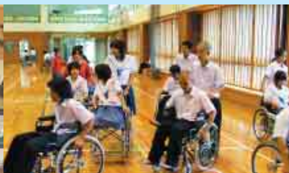
▲ 車いす体験 玉城中学校 3年生

社協でもこうした体験プログラムの提案や、地域の障がい者、高齢者等の派遣調整を支援しています。次代を担う南城っ子が思いやりの心を育み住みよいまちをつくっていくことでしょう。