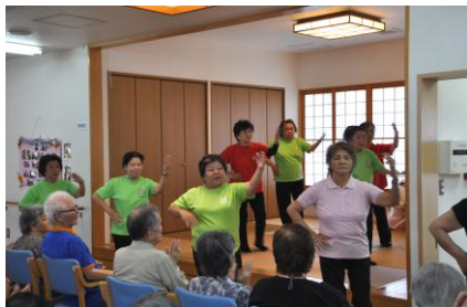
美童クラブによるダンス披露

5月23日（水）に大里字稲嶺にあるデイサービスセンターで、市内のボランティア団体「美童（みやらび）クラブ」による健康体操やダンスの披露が行われました。