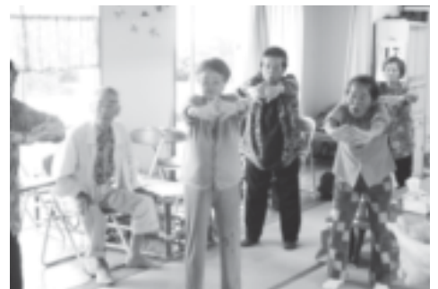
予防運動による筋力アップ↑