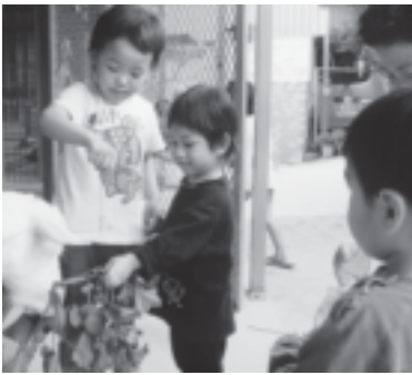
動物とのふれあい

〇才〜六才児を預かり、リズム、散歩、砂水どろんこ遊び、鬼ごっこ等の集団遊び、雑巾がけ、小動物の世話、野菜づくり、