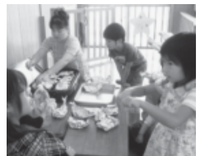
めばえ広場（クッキング）

地域行事の参加などの活動を通し、丈夫でしなやかな体をつくり、自分を大切に、仲間や環境にやさしく、意欲や最後までやりぬく忍耐のある子を育てています。