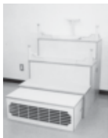
写真左：祭壇 写真右：飾り付け例