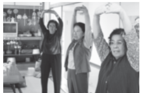
柔軟体操は、転倒予防の基本です