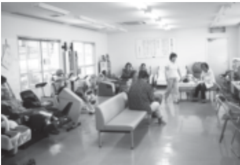
思い思いの器具を使って健康維持

平成20年5月から65歳以上の高齢者を対象に転倒骨折予防教室「がんじゅう教室」が始まります。これまでの玉城・知念地区に加え南城市全地区で実施することになりました。 この事業は、加齢による身体機能の衰えを筋力トレーニングや柔軟体操等を行うことで「転倒↓骨折↓寝たきり」を予防することを目的としています。又、月に1回は理学療法士による指導も受けられます。ぜひ「転ばぬ先の杖」として「がんじゅう教室」を利用して心身ともに健康でいきいきした人生を過ごしましょう！