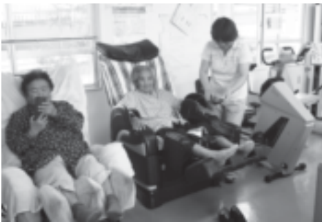
マッサージチェアで筋肉のこりをほぐします