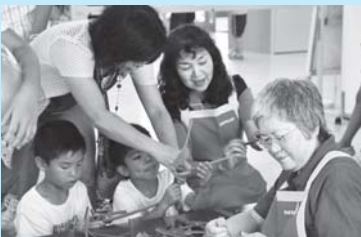
民生委員の皆さん

協力していただいた団体（順不同） 南城市青年連合会、南城市体育指導員、南城市食生活改善推進協議会、南城市民生委員児童委員連絡協議会、大学生ボランティア、知念小中ボランティア、島尻消防清掃組合消防本部、与那原警察署、南部国道事務所、（株）東部電気土木、守礼カントリークラブ、日本自動車連盟沖縄支部（JAF）、チェリーガールズ、セーフア太鼓、各保育所（園）、知念文化財案内友の会、子育て支援ボランティア