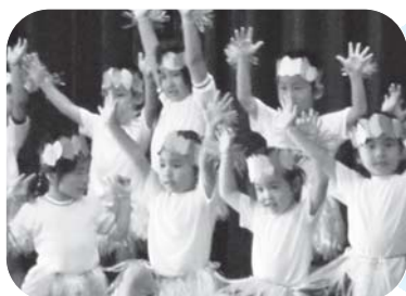
舞台発表に出演したかわいらしい子ども達