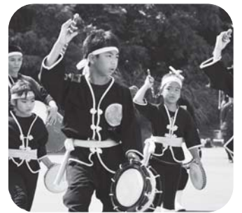
セーファ太鼓の皆さん