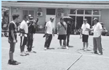
ルール説明をする体育指導員の皆さん