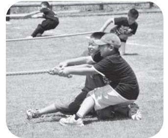
けっこう強いぞー