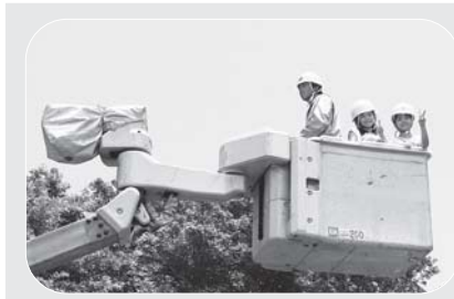
高い場所からのながめは最高です。