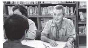
先生方と熱心に情報交換