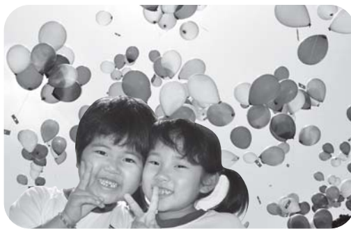
私達の夢をのせて飛んでけー