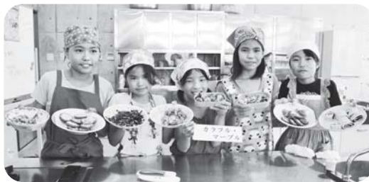
大人顔負けの腕前で「教育長賞」に輝いたカラフル・マーブルチーム