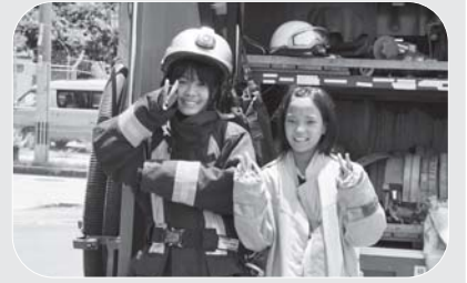
将来は女性消防士(?)