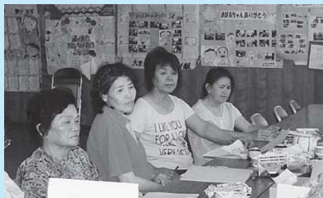
事業の説明を受ける地域支援員の皆さん