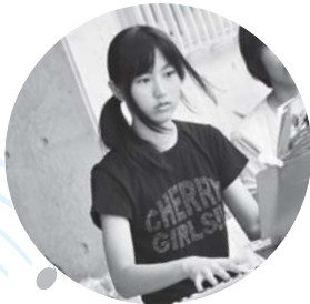
オープニング演奏を担当したチエリーガールズ

第四回目を迎えた子どもまつり、大勢の子ども達が楽しめるようにと、イベント内容を工夫し、保育園・幼稚園児による舞台発表や、南城市の「弁当の日」に興味関心をもってもらおうと小中学生による「キッチンスタジオム」、「はたらく車大集合!」、「手作りおもちゃコーナー」、「大なわとび」、「三色つなひき」など盛りだくさんで、会場いっぱい子ども達の歓声と笑顔の花が咲きました。