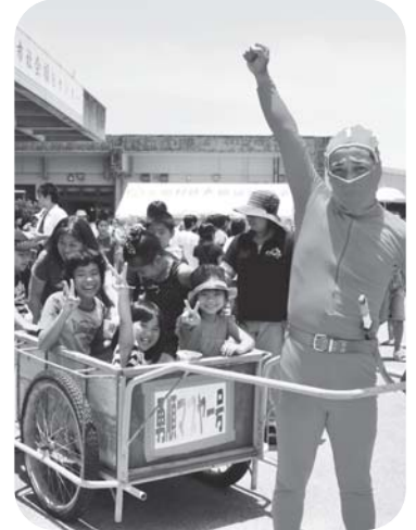
大人気の“勇順マブヤー”