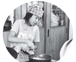
見事な手さばきで厚焼き玉子完成