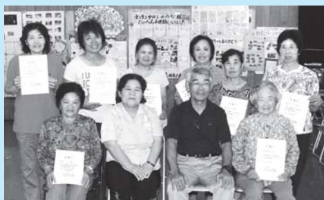
委嘱状を手にする気マンマンの皆さん

今後は、普段の訪問活動を実施しながら、区長や民生委員さんと連携を密にしていくとともに、地域の支え合いマップ作りを手がけていこうということを確認しました。