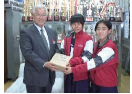
大里中学校 学童募金