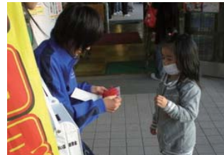
小さなお子さんも協力してもらいました。