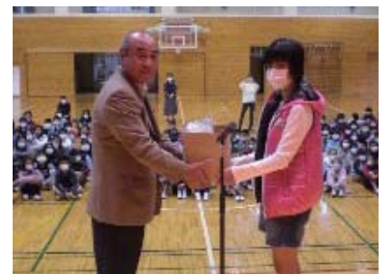
百名小学校 募金贈呈式