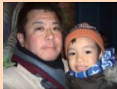
大好きなとっとおと一緒に!

仕事や家事をしながら、ドローインを意識するだけで・・・3ヶ月後には、ズボンが1サイズ変わっているかも・・・