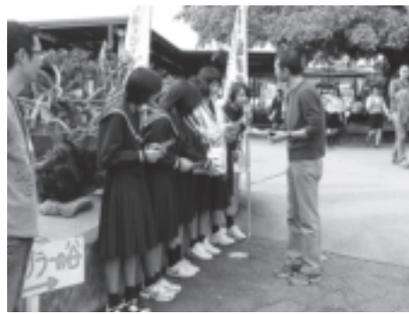
▲玉城中学校 玉泉洞にて