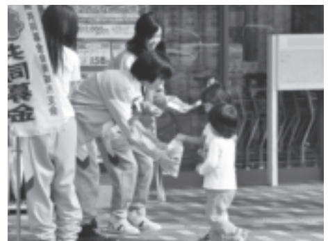
▲知念中学校 マックスバリュ佐敷店にて