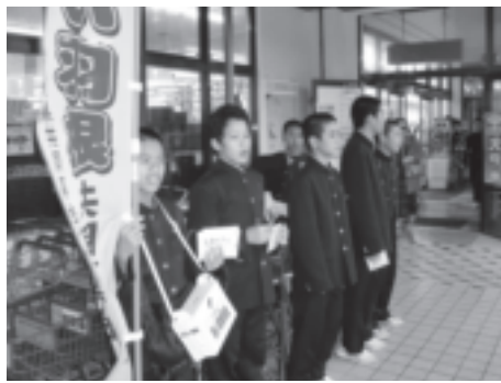
▲佐敷中学校 丸大佐敷店にて