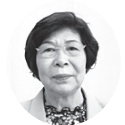
知 名 屋 我 和 子