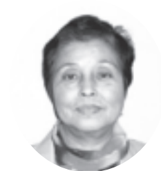
知 名 親 川 園 子