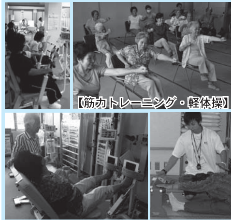
【筋力トレーニング・軽体操】

「がんじゅう教室」開設日 佐敷地域：毎週火・木・金 ○南城市老人福祉センター 知念地域：毎週月・水・金 ○知念児童屋内体育館 玉城地域：毎週月～金 ○南城市福祉センター 大里地域：毎週月・水・金 ○南城市総合保健福祉センター 久高地域：毎月第2・4土曜日 ○久高離島振興総合センター 午前の部：9時～12時 午後の部：13時～16時 利用料金：無料