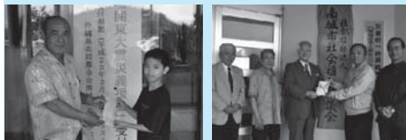
(大南小男子 ミニバスケット部) (知名二水会)