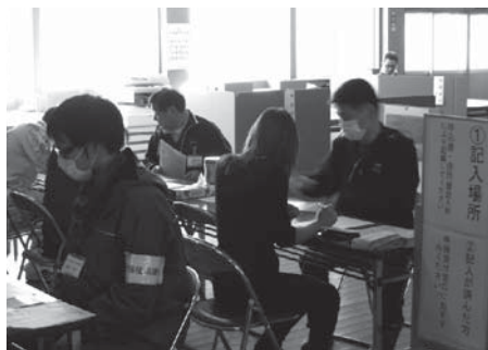
福島県に本会職員を派遣して現地での貸付相談業務を支援

機関で構成される義援金配分委員会が決定後、被災者に配分されます。災害義援金については引き続き受付をしておりますので、ご協力宜しくお願い致します。