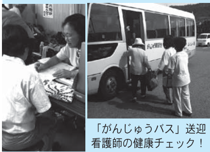
「がんじゅうバス」送迎 看護師の健康チェック!

年齢を重ねると、なかなか身体がいうことをきいてくれません。「がんじゅう教室」では65歳以上の皆さんを対象に身体機能の維持向上を図ることを目的に、健康運動指導士や理学療法士等による専門的な指導を行っています。あなたも一緒に参加しませんか。今すぐ、お電話下さい。