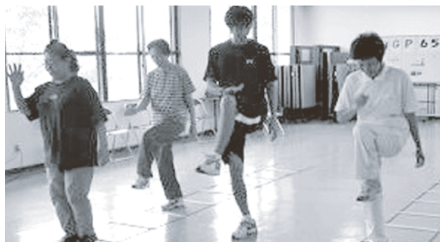
ラダートレーニング中（玉城）