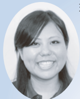
琉球リハビリテーション学院 社会福祉学科