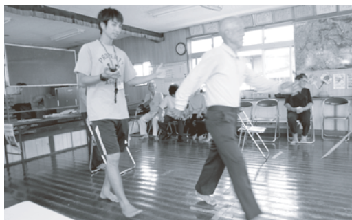
9/21 堀川区 「タイムアップ&ゴー」 歩く、座る動作を組み合わせた能力を測定

健康運動指導士による体力測定を実施し、身体機能の現状を知り、今後の日常生活における運動の大切さについて実技を交えて学ぶ。