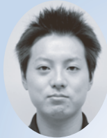
沖縄大学 人文学部 福祉文化学科 4年次

私は、今回南城市社会福祉協議会で約1か月の実習を通して様々な経験をさせて頂きました。ミニデイサービスや作業所等での実習では実際に利用者とおふれあうことによって、大学の講義では知ることのできない実際の現場、地域の声を聞けてとても勉強になりました。また、助成事業審査会へも参加させて頂き、各地域住民の様々なニーズを知ることなど、社協ならではの事業も学ばせて頂きました。この実習での経験、また実習も通じて自分の良かった点、悪かった点を見つめ直し、これからの学習、活動へ活かしていきたいと思います。本当にお世話になりました。ありがとうございました。