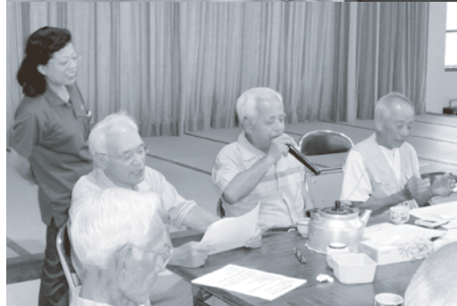
9/12 富里区 講師：青の空 講座の前に歌う事で脳の活性化促進と緊張をほぐす