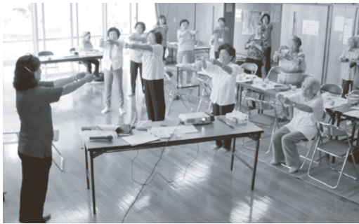
9/4 垣花区 講師：青の空 「目を閉じて指合わせゲーム」