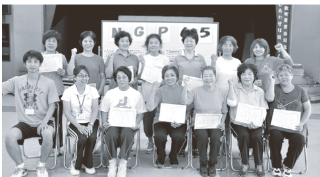
「もっと続けた〜！」（佐敷）