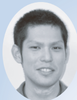
琉球リハビリテーション学院 社会福祉学科

約2か月にわたり、南城市社協で実習させていただき、社協の地域での役割や働き、地域住民との関わりをはじめ、多くのことを勉強させていただきました。 また、子育て、児童分野から障がい者や高齢者、ボランティア等、様々な事業に関わらせていただき、広く福祉分野について知ることができました。実習前から気になる事業としてあげていた「子育てサロン」や「ファミサポ」にも参加し、利用者との関わりや話を聞くことで、ニーズや目的、また課題についても学ぶことが出来ました。また、様々な事業が社協だけでなく、住民、民生委員さん、関係機関との連携の上に成り立っていて、その中での社協の役割を勉強することが出来、実習で、地域福祉について理解が深まりました。 学んだことを活かし、今後さらに勉学に励み頑張りたいと思います。