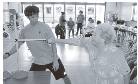
9/11 湧稲国区 「ファンクショナルリーチ」 動的バランスを測定