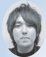
沖縄大学 人文学部 福祉文化学科 3年次

社会福祉協議会の事業はお寄せいただいた多くの寄付金等によって支えられ実施しています。