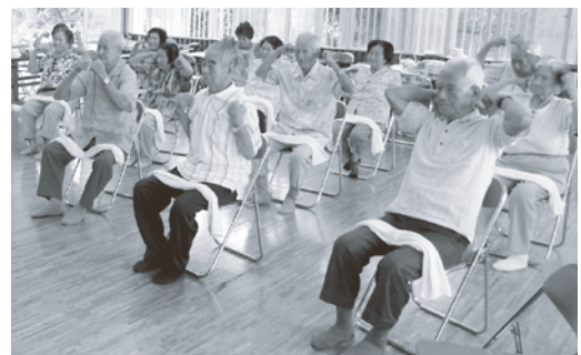
9/19 当間区 「ていーさーじ体操」を 行う前にストレッチ

参加者の声 「ていーさーじ体操を続けて体力維持に努めたい」、「体力がつく介護予防についてもっと学びたい」など