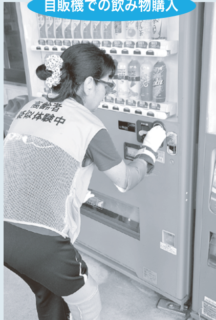
自販機での飲み物購入