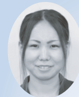
沖縄国際大学総合文化学部 人間福祉学科

今回、南城市社協で約2か月の実習をさせて頂き、様々な事業に参加させて頂きました。その中でミニデイサービスやワークセンター等、地域の高齢者や障害者、民生委員等、幅広く地域住民の人達と関わることができました。特に「がんじゅう教室」では私でもきついと思った体操を、90歳をこえる人も元気に行っていたので驚き、逆に私が元気をもらいました。 今回の実習では、民生委員や青年会等地域住民と社協、行政が連携、協力していることも見られ、社協や地域福祉について多く学ぶことができました。ありがとうございました。