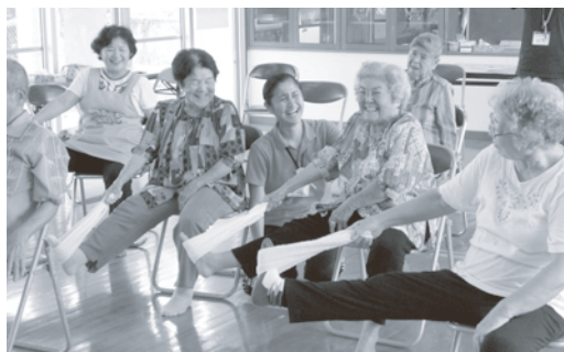
10/5 福原区 「ていーさーじ体操」