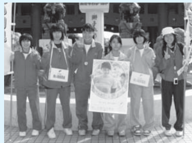
12/7 おきなわワールド文化王国・玉泉洞 (玉城中学校)