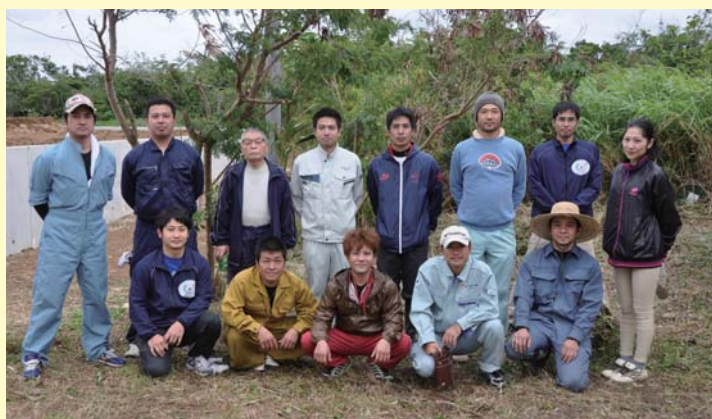
▲南城市商工会青年部