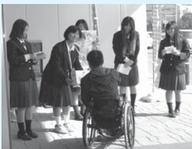
11/30 イオンタウン南城大里 (向陽高等学校)