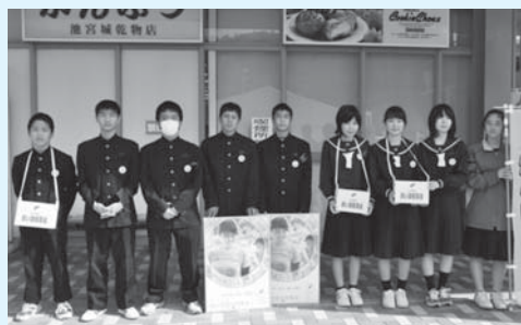
11/30 ザ・ビッグエクスプレス佐敷店 (知念中学校)

赤い羽根共同募金運動の一環として、市内4つの中学校と向陽高等学校の協力(街頭募金)でたくさんの募金が集まりました。募金にご協力いただいた皆さん、募金奉仕者の生徒の皆さんありがとうございました。