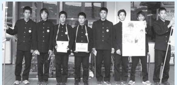
12/10 ファミリープラザ丸大佐敷店 (佐敷中学校)