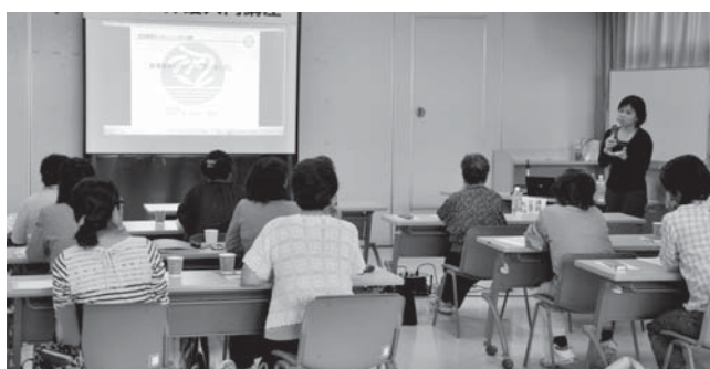
認知症について～正しく理解しよう～