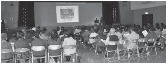
平成24年度 地域活動実践報告会の様子

南城市内の保育所小中学校(ボランティア推進校)や地域で福祉活動を行う団体等の活動実践報告会を開催致します。