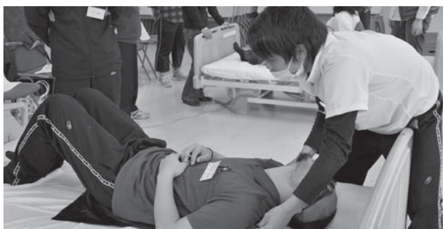
ベッド上での移動～ゴミ袋を使ってみると...～