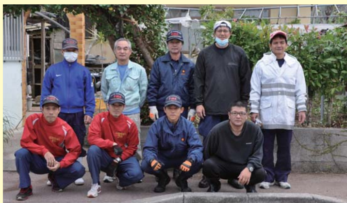
▲島尻消防清掃組合