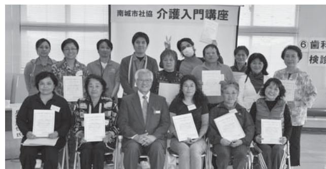
晴れて修了証書を手実践あるのみ...頑張るぞ～