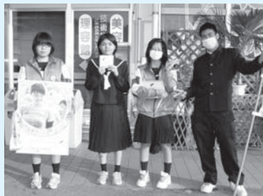
12/2 Aコープアトール店 (大里中学校)