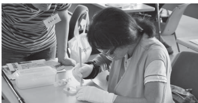
高齢者疑似体験(箸でのまめつかみ)目は見えにくい結構むづかしい...

南城市地域包括支援センター、沖縄県介護実習普及センター、特別養護老人ホームしらゆりの園、特別養護老人ホーム東雲の丘、介護老人保健施設おおざと信和苑(開催順)