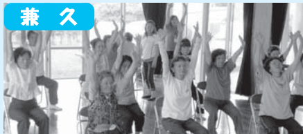
ゲーム前にしっかり体操!