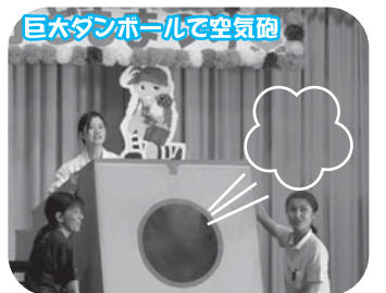
巨大ダンボールで空気砲