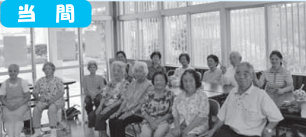
カラオケ時にハイポーズ!