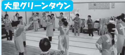
納涼祭に向け練習中!