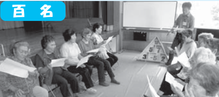
ね～トンコ・トンコ～♪