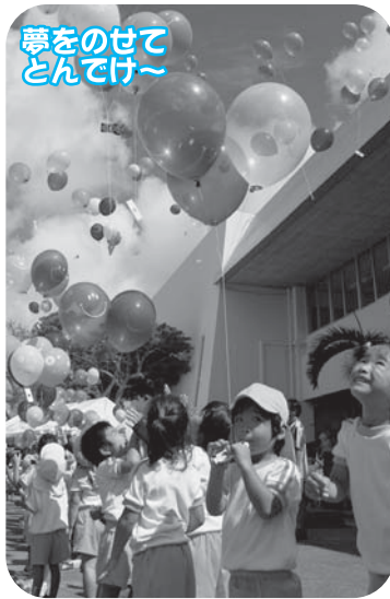
夢をのせてとんでけ~