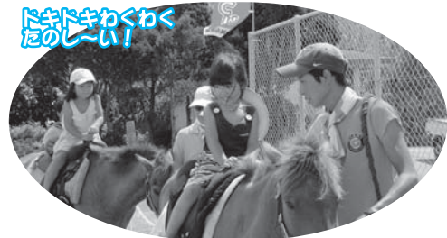
ドキドキわくわく だのし~い!