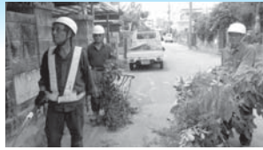
シルバー人材センター