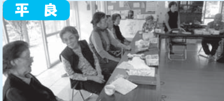
ここに来るのが毎週の楽しみよ～!