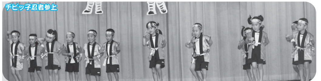
チビッ子忍者参上