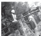
お掃除ボランティア