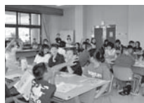
ボランティア活動推進校