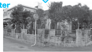
こんなにきれいになりました