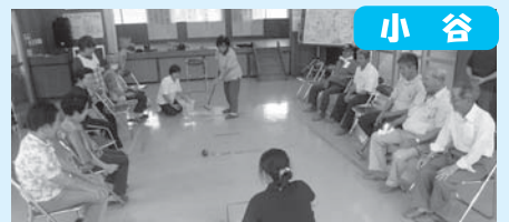
男性陣も増え、賑やかになりました～♪