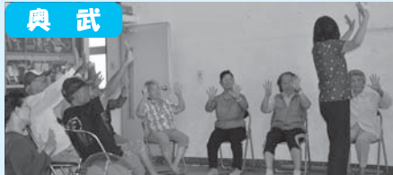
脳トレ指折り運動1・2・3・・・