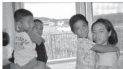
あおぞら、あおぞら第2保育園にて

かお手伝いすることはありますか」の一言が大切であるという事を学びました。参加者からは、「意味があって生まれてくる。命に差はない。の言葉が心に残りました。」「これからは、街中で困っている人がいたら積極的に声をかけたい。」といった感想が聞かれました。