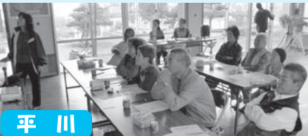
「認知症予防教室」予防は今から!