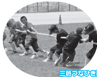
三色つなひき勝つのはどっち?