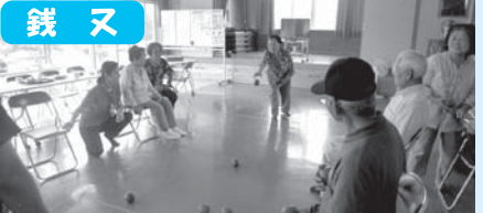
思うところに行け～♪