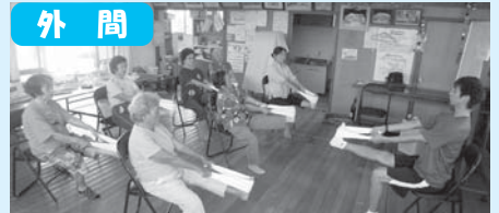
これは家でも出来るね♪