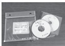
声の広報配布事業