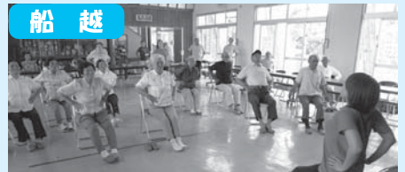
体もスッキリ気持ち良いね～