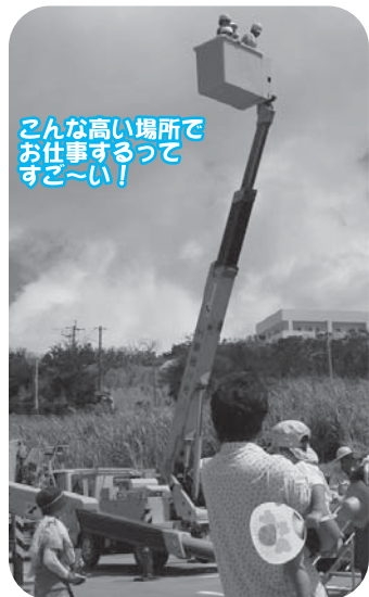
こんな高い場所でお仕事するってすこ~い!