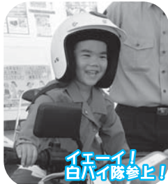
イエーイ! 白バイ隊参上!