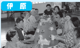
レク後の一息は最高!