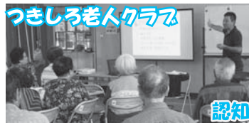
つきしろ老人クラブ