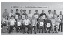
フックン・シーちゃん助成事業