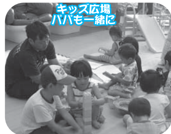
キッズ広場 パパも一緒に