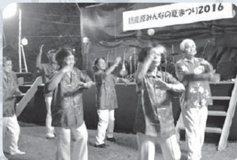
おどるシンカヌチャー