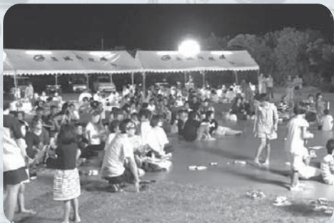
子どもからお年寄りまで交流を深める

夏まつりをより良くするため、執行部、女性会、老人会、青年会OB会、青年会とのコミュニケーションの機会が増え、これからも継続的なまちづくりにかかせない繋がりができました。ありがとうございました。