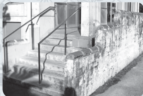
階段に手すりを設置

佐敷公民館では、ミニデイ等で多くのお年寄りが利用していますが、駐車場に抜ける階段に手すりがなく危険でしたが、今回の「フックン・シーちゃん地域福祉活動助成金」で手すりを設置することが出来ました。体が不自由な方やお年寄りが公民館を利用しやすくなり、今後の字事業にも多くの方々が参加出来ます。ありがとうございました。