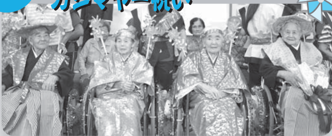
家族も職員も皆で長寿をあやかりました