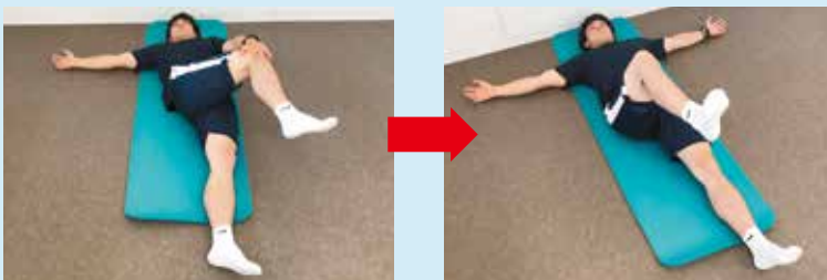
ヒップストレッチ