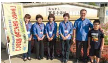
百名小学校 玉城民児協

毎年5月12日は「民生委員・児童委員の日」と位置付けられ、5月12日～18日の1週間を「民生委員児童委員活動強化週間」とし、地域住民の立場から福祉行政との橋渡しの役割を担う民生委員・児童委員の重要性を広く周知するための活動が全国的に展開されています。南城市では単位民児協で民生委員の説明が入ったポケットティッシュを学校やスーパー前で配り、市民の皆様へPRしました。