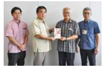
光南建設(株)津波克守社長 (左から2番目)