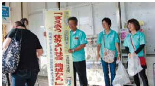
丸大佐敷店 佐敷民児協