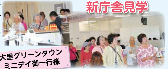
大里グリーンタウン ミニデイ御一行様