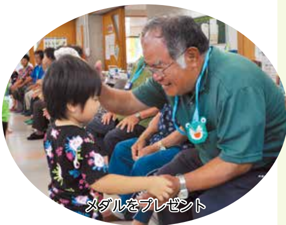
メダルをプレゼント

最後は、子ども達手作りのメダルを利用者の皆様にプレゼントし、とても賑やかな交流会となりました。 地域に保育園が開園したことで、今後も交流が続くことが期待できますね。