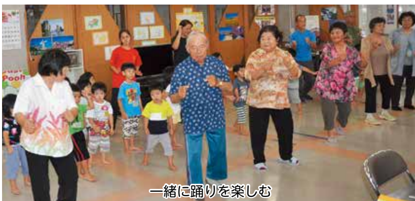
一緒に踊りを楽しむ

6月14日(木)に大里の南風原区公民館にておおざと保育園と南風原ミニデイの交流会が行われました。 始めに、子ども達による自己紹介をした後、「紅芋娘」と「ウルトラマンタロウ」のお遊戯を元氣よく披露しました。 また、子ども達による手作り竹とんぼをミニデイ利用者と一緒に飛ばして遊んだり、踊ったりと「子ども達は、とてもかわいいうわあ〜さ〜」といったにも増して素敵な笑顔が見られました。