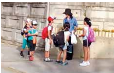
知念小学校 知念民児協