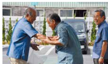
サンエー嶺井店 大里民児協