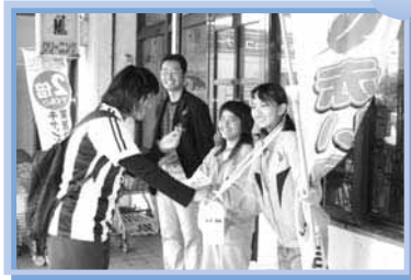
「赤い羽根街頭募金」 佐敷中学校 ファミリープラザ丸大佐敷店にて