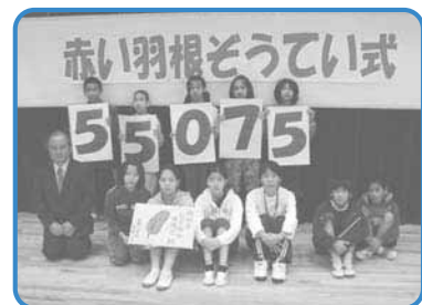
「赤い羽根贈呈式」 佐敷小学校児童会のみなさん