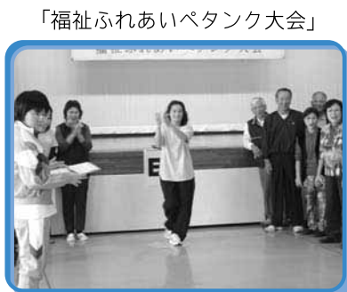
「福祉ふれあいペタンク大会」