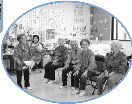
「センターミニデイサービス事業」