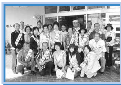
奉仕員による募金事業所まわり