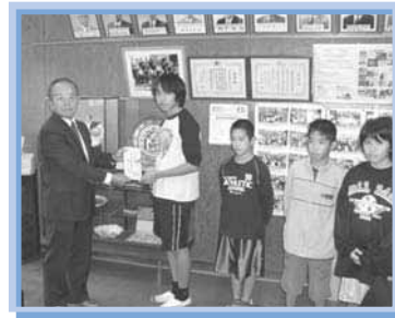
「赤い羽根贈呈式」 馬天小学校児童会のみなさん