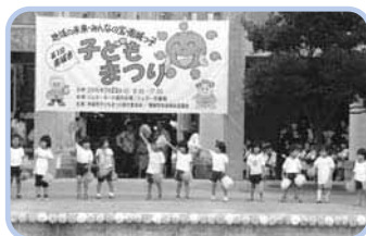
「第1回南城市子どもまつり」