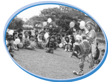
「ふれあいもちつき交流会」