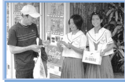
「赤い羽根街頭募金」 玉城中学校 玉泉洞にて