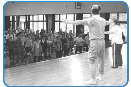
「平成18年度 大里いきいきサロン全体集会」