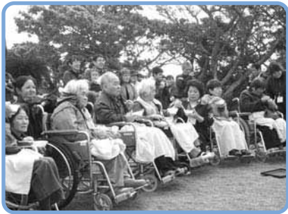
「ふれあいまちつき交流会」