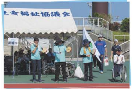
民生委員さんたちの応援