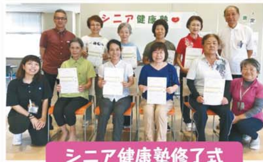
シニア健康塾修了式