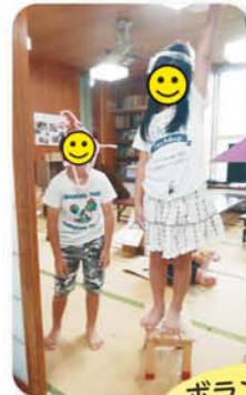
「がじゅまる」の 自由の女神