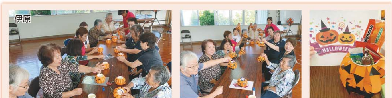
10/9 伊原にて ハロウィンかぼちゃのお菓子カゴ作り