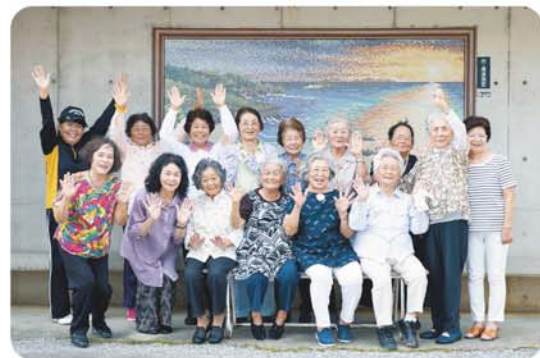
笑顔が素敵な会員さん

Universal Design 本誌はメディア・ユニバーサルデザイン・アドバイザー検定3級取得者の確認・校正作業を経て発刊しています。