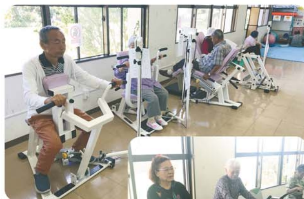
筋力トレーニング マシーン