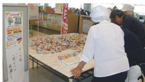
ちんすこう袋詰め作業体験