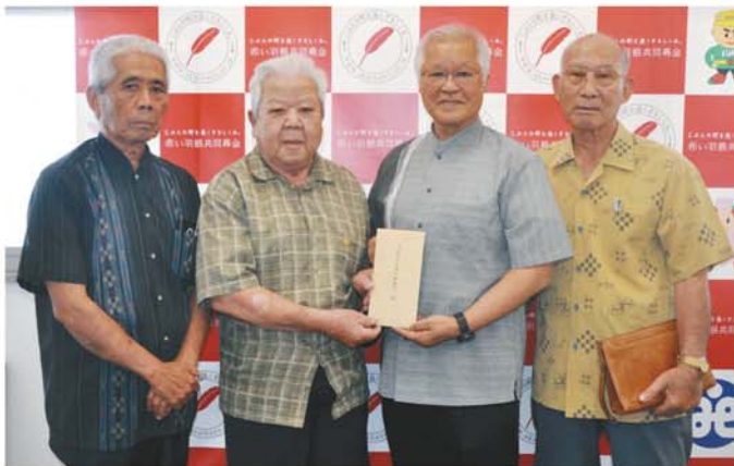
南城市佐敷農産物直売所利用組合 様