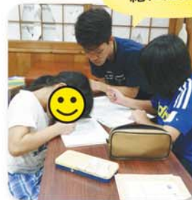
ボランティアさんと 一緒に勉強&トランプ