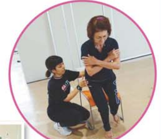
シニア塾・体力測定