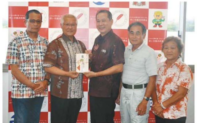
沖縄県農業協同組合南城支店 様