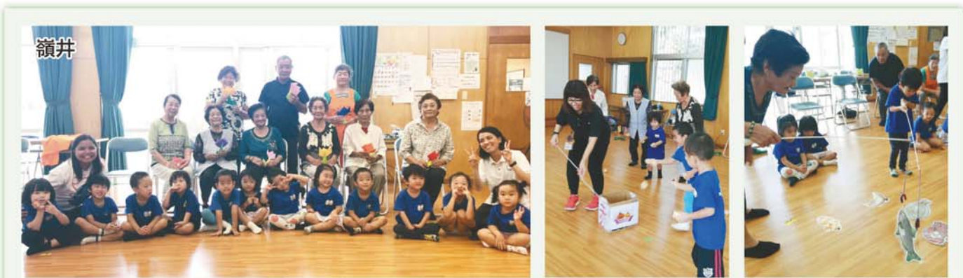
10/11 インターナショナルスクールの園児との交流会(魚釣り・玉入れ・ダンス披露)

こんにちは、花城です。今回のミニデイ訪問記は沖縄から世界へ文化の交流や体験を楽しんで頂きました。Thank you so much (本当にありがとう!)