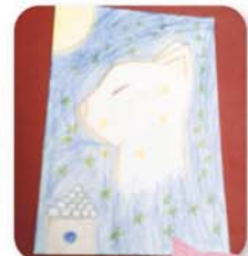
子ども新聞に 掲載されました