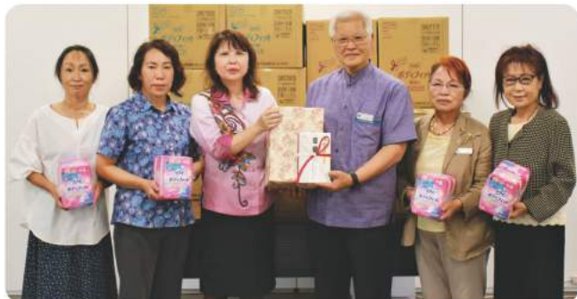
沖縄県宅地建物取引業協会(女性部会「まごころボランティア会」)様より、生理用品468パックの寄贈を頂きました。