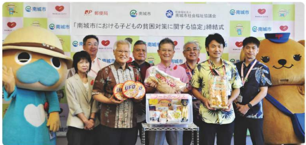
「南城市における子どもの貧困対策に関する協定」締結式