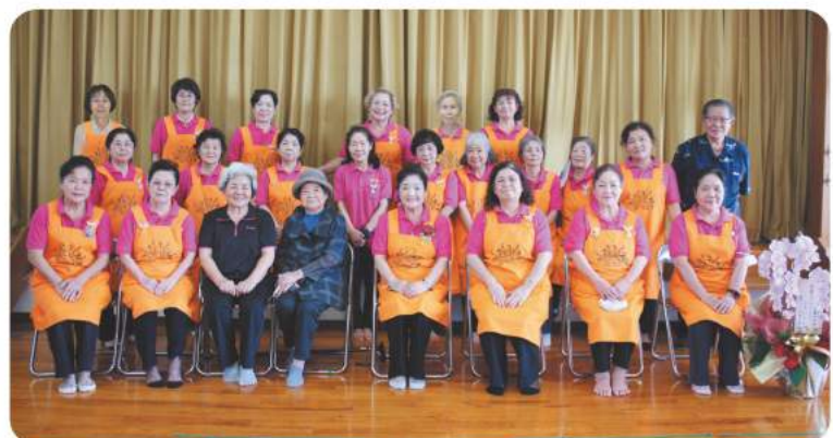
おそろいのオレンジのエプロンで気持ちを一つに！

【活動のモットー】 生きがい、健康づくりを共に助け合う「共助」の精神で取り組んでいます。笑顔一番！