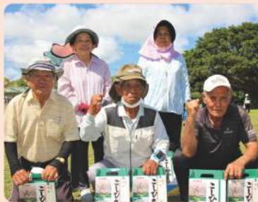
1コート 前川若水会