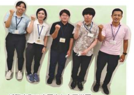
近隣市町の実習生と合同学習

大学の講義では、実際に現場に出る機会はないので、様々な事業について学んでも、あまりイメージが出来なかった部分が多々ありました。しかし今回、南城市社会福祉協議会で実習を行い、実際に現場で支援しているところを見学したり、がんじゅう教室、野の花等での体験などを通して、各事業が行っている活動について強く印象に残ったので、とても良い経験になりました。また、常に相手の話に疑問を持つようにするなど、福祉の視点について色々と学ぶことができたので、この経験や学んだ福祉の視点を今後活かしていき、様々な人達とも関わりを持って、自分が知らない知識などをどんどん吸収していけたらと思います。それから、前年度より新型コロナウイルスの感染者が爆発的に増加している状況下で、ほとんどの事業が活動を行えていない現状があり、そのことから、新型コロナウイルスの影響は福祉活動等にも大きな影響を及ぼしていると実習を通して初めて知ることができました。しかし最近では、活動が長い間休止になっていたミニデイが再開したりなど、とても良い方向に進んでいっているので、これからの展開が楽しみです。最後に、コロナ禍で感染者も爆発的に増え、実習受け入れがとても厳しい時期に快く受け入れてくれて、実習開始から最後まで常に優しく対応してくださった南城市社会福祉協議会職員の皆様、また、関わらせていただいたその他の皆様、本当にありがとうございました。