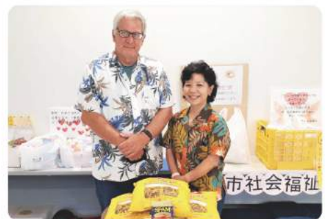
キャンベル夫妻様より