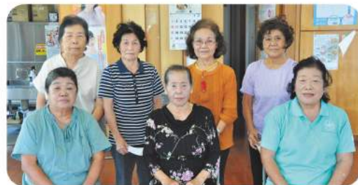
パワフルな活動が地域の力になってます

【活動歴】 21年11ヶ月 【団員数】 4人 【活動頻度】 毎週金曜日 月4回 年間48回 【活動のモットー】 みんなの元気が次の元気を生み出す。いつも元気パワーを送ります。