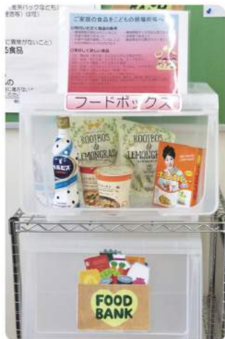
市内4郵便局に設置されたフードボックス

10月4日(月)、日本郵便(株)沖縄支社、南城市、市社会福祉協議会は「南城市における子どもの貧困対策に関する協定」締結式を行いました。協定は、郵便局が地域のお客さまに家庭などで余っている食品を寄付する活動「フードドライブ」を呼びかけ、市内4郵便局に「フードボックス」を設置し取り組むものです。集まった食品は市内4カ所の「子どもの居場所」などで活用されます。