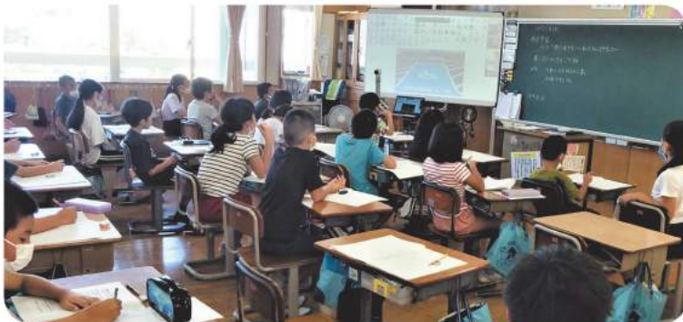
オンラインでの講話 集中して聴いています