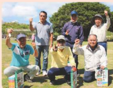
3コート 南風原食栄森会