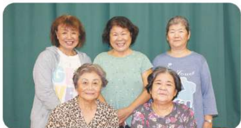
地道にそして息の長い活動を続けています。

【活動歴】 22年6ヶ月 【団員数】 5人 【活動頻度】 毎週金曜日 月4回 年間48回 【活動のモットー】 参加する利用者と共に、健康長寿を目指し、楽しく笑顔で過ごすこと！