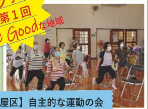
【志喜屋区】自主的な運動の会