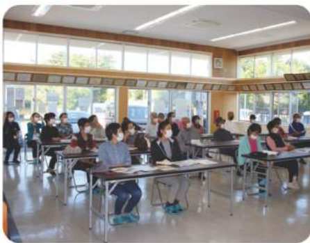
11/15 月 当山区 【認知症について知ろう】