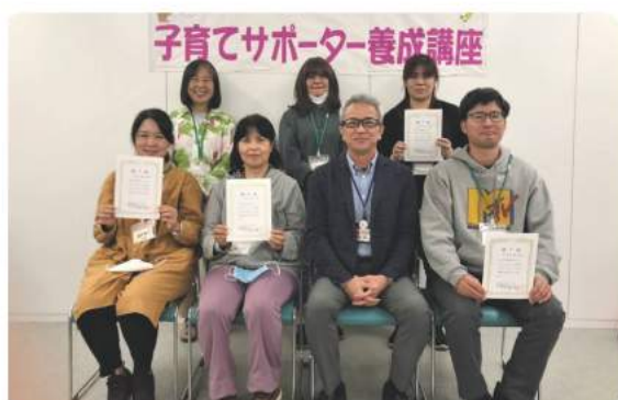
修了証を受け取った受講者の皆さん

受講生は、南城市ファミリーサポートセンターのサポート会員として登録され、今後は地域で子育ての手助けが必要な方々のサポーターとして活躍が期待されます。