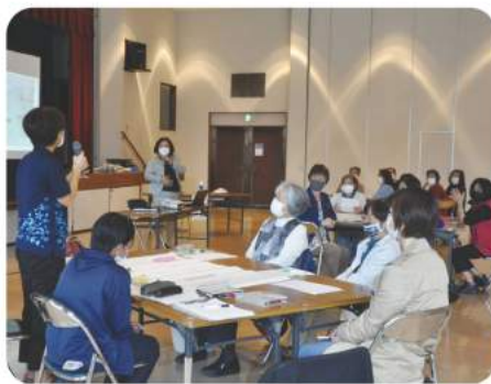
11/29 月 ちんにん太陽 ていだ ぬ会 【傾聴ボランティア】