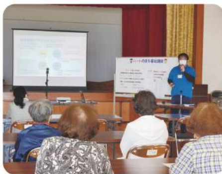
11/10 水 志喜屋区 【介護保険制度の動向】