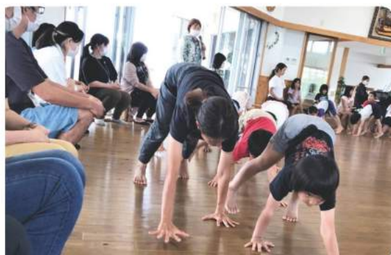
あおぞらこども園へ施設訪問