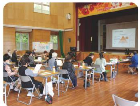
11/10 水 前川区自治会 【認知症について知ろう】