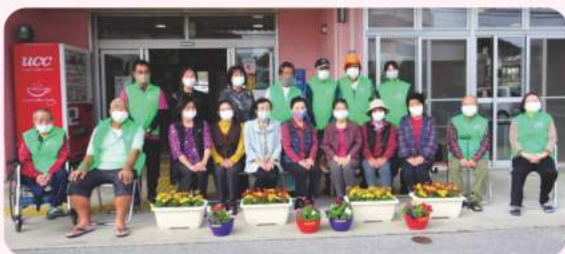
南城市女性会・大里支部の皆さんと利用者さん