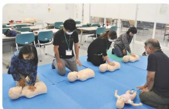
救急救命の受講の様子