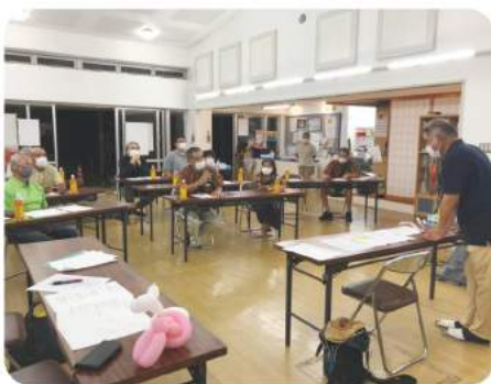
10/29 金 平良区自治会 【災害に強いまちづくり】

本講座は、誰もが住みなれた地域で暮らし続けることができる地域社会の形成に向けて、思いやりをもって共に支え合い、助け合う地域福祉活動への関心を深めていただくことを目的としています。