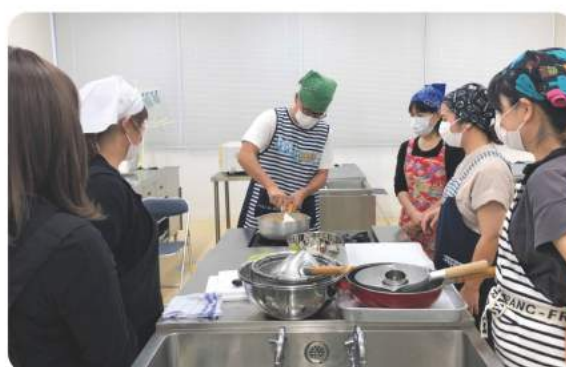
子どもの栄養と食生活(調理実習)