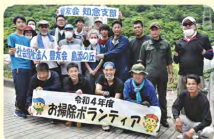
陸上自衛隊曹友会知念支部・島添の丘