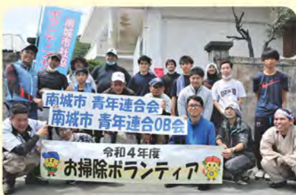
南城市青年連合会・南城市青年連合OB会