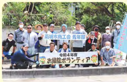
南城市商工会青年部