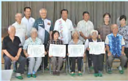
目取真区伝達式(4名)

永年にわたり地域ミニデイサービスのボランティアとして貢献された皆様に、感謝状と記念品が贈られました。おめでとうございます!