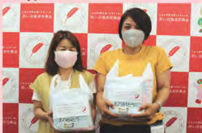
フードドライブ食材で コロナ自宅療養者へ食料支援