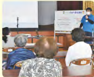
ハートのまち福祉講座

地域や学校などで様々な交流・学習・福祉体験活動を通して、地域の様々な福祉課題に気づき、自分たちにできることは何かを考え、「ともに生きる力」を育み、共生の地域づくりの実現に取り組んでいます。