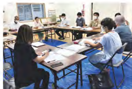
嶺井団地自治会「地域支え合い委員会」