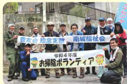
陸上自衛隊曹友会知念支部・南城福祉会