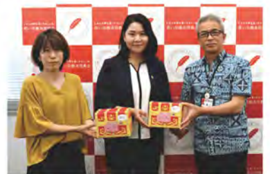
南城市母子寡婦福祉会 様