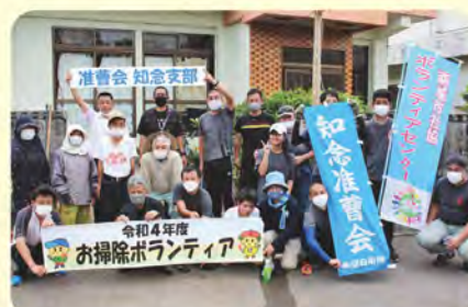
航空自衛隊知念准曹会