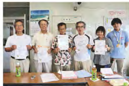
新里区「地域支え合い委員」の皆さん