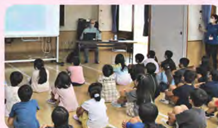
真剣な表情で耳を傾ける子ども達

参加した児童からは「自分の友達が元気がない時はどうしたらいいの?」「私も苦しくなることがあればお父さん、お母さんや学校の先生に話してみようと思う」などの声があがった。