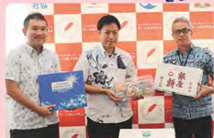
街クリーン株式会社 様