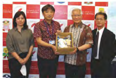
沖縄県労働金庫与那原支店 様