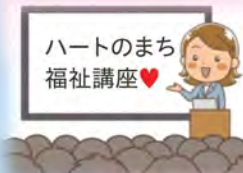
ハートのまち 福祉講座