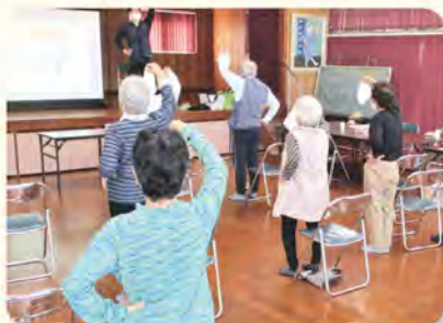
【高血圧の正しい知識と運動】