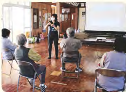
【尿失禁予防・感染予防】

南城市では今年度も、高齢者の健康づくりを応援する「介護予防教室」を開催します。サークルや模合仲間(5名以上)などいつまでも若々しくいたいという皆様、お友達同士で受講してみませんか。あなたの今後の健康生活に役立つ情報が満載です。