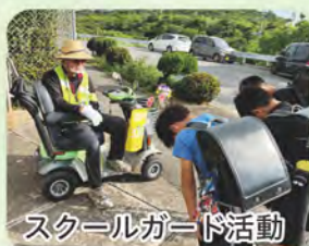
スクールガード活動