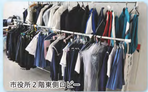
市役所2階東側回ビー