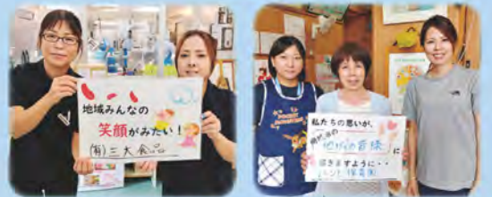
「赤い羽根」地域みんながサポーター