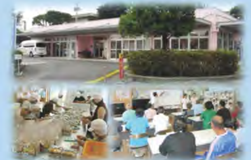
障がい者の相談・居場所支援「野の花」