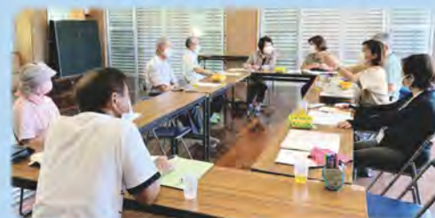
各地域で見守りネットワーク体制構築