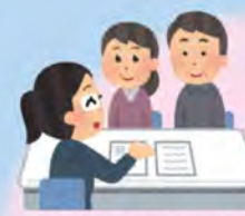
「くらしの相談窓口」

地域の身近な相談相手として活動する民生委員児童委員と連携し、地域福祉の推進に取り組みます。（事務局運営）