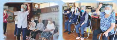
健康づくり・生きがいがづくり・居場所づくり 笑顔満開！各地域でミニデイサービス