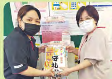
高嶺大里郵便局長(右)より 「ピックママハウス」へ