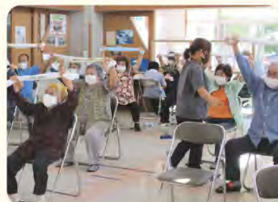
【日常生活動作を楽にするトレーニング法】