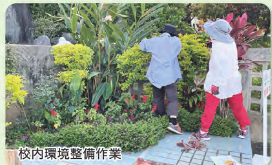
校内環境整備作業