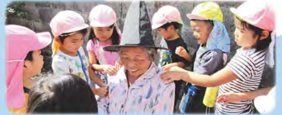
ちびっ子見守り隊

地域のムラヤーを拠点に「くらしの相談窓口」「地域支え合い委員会」の開設、「ハートのまち福祉講座」の開催をとおして、誰もが支え合いながら安心して暮らすことができる「ともに支え、ともに生きる豊かな地域社会」を目指し、今年度希望する地域を指定して、地域と協働して取り組みます。