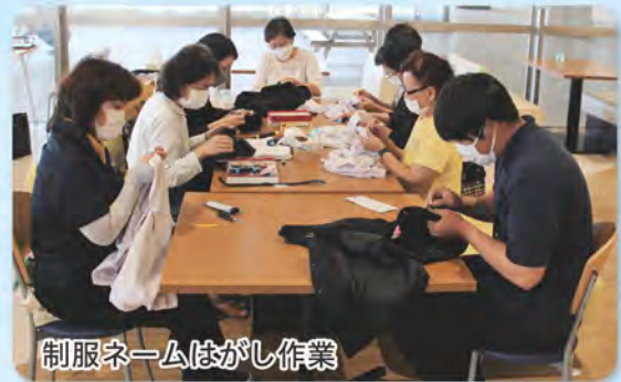
制服ネームはがし作業

現在、市内の中学校だけでなく高校の制服の提供も増えています。制服や体育着をお探しの方、制服や体育着を提供して頂ける方は南城市役所2階東側回ビーに是非お越しください！