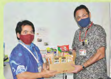
大嶺玉城郵便局長(右)より ほっとハウス「がじゅまる」へ