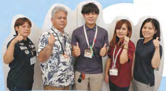
地域福祉コーディネーター