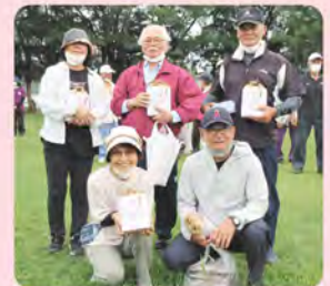
2コート 久原チーム