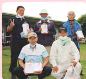
3コート 当間チーム