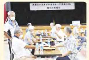
真剣な表情で熱戦展開中!