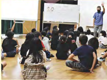
「みんなができるしあわせのお手伝い」に 多くの意見が聞かれました。

10月13日、知念小学校3年生を対象に「ふくしの心を育てる授業」～民生委員・児童委員の活動をとおして～と題して、福祉講話が行われました。講師を務めたのは知念地域の民生委員(主任児童委員)の皆さん、民生委員の役割・活動や地域で取り組まれている様々な支え合いの活動などを紹介しました。