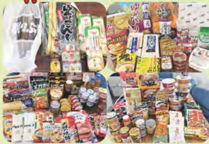
社協職員の皆さんより食料品提供