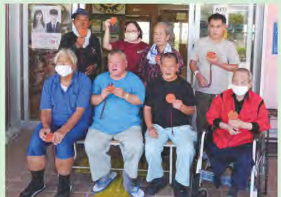
完走めざしてガンバレー！

日頃、お菓子の袋詰めなどの軽作業に取り組む南城市地域活動支援センター「野の花」利用者の皆さん、今年3年ぶりの開催となる尚巴志ハーフマラソンの完走者に贈られる陶製のメダルにひもを通す作業に汗を流しました。野の花では、第11回大会からメダル作成に携わっており、今回も5千個余りのメダルを参加者全員のゴールを願いながら、5日間かけて完成させました。