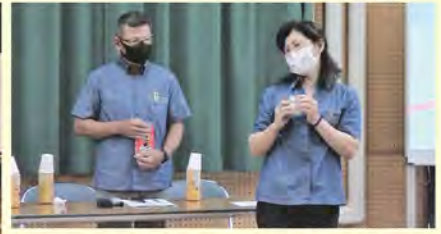
手品を交えた自己紹介に大歓声！つかみはOK