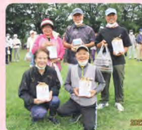
3コート みどり会(GT)チーム