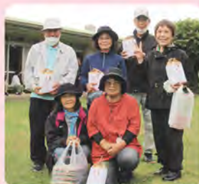
4コート 喜良原チーム