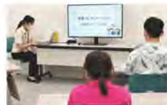
実習生による企画提案 プレゼンテーション

社協では、地域を支える「福祉人材の育成」を大切な役割と考え、今年度も社会福祉士養成課程における「相談援助実習」の受け入れを行いました。