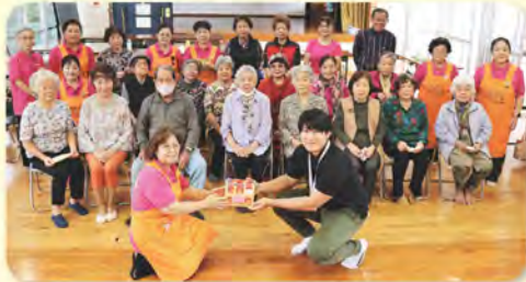
大里グリーンタウン、ミニデイサービス利用者 & ボランティア(介護予防部)の皆さんから