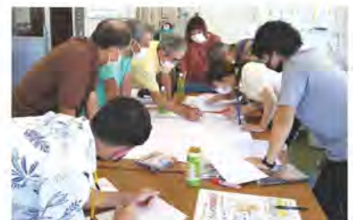
地域支え合いマップ作成