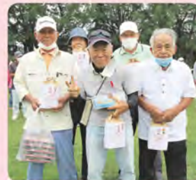
1コート 仲伊保チーム