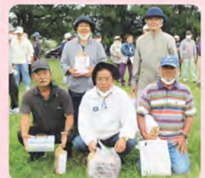
4コート 親慶原チーム