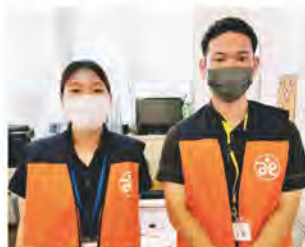
台風時要支援者見守り

今回の実習を通して得た学びはこれからの学習で生かしていきたいと思います。最後に、実習で関わってくれた皆様、本当にありがとうございました。