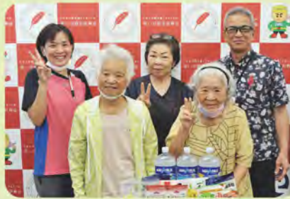
しののめの丘 小規模多機能型 居宅介護事業所様