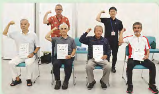
運動継続で体力向上を実感！ 修了生の皆さん

男性の皆さんを対象に開催された健康づくり講座「男塾」(全10回)の修了式が行われました。