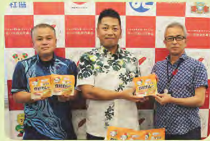
株式会社オーディフ様