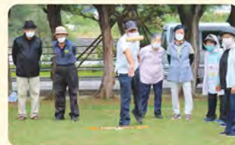
モルック逆転の一投!