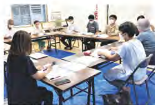
地域支え合い委員会