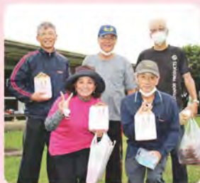
1コート 玉城チーム