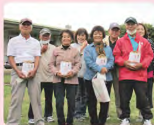
2コート 知念チーム