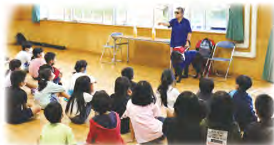
共に生きる共生のまちづくりに向けて、市内小学校で福祉教育の推進