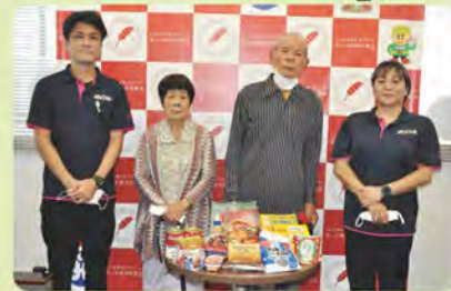
▲ しののめの丘 小規模多機能型 居宅介護事業所 様