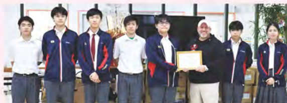
HELP OKI合同会社へ寄贈の様子

バンビ保育園では、12月13日(火)にサンタクロースに扮した生徒たちが、絵本の読み聞かせやダンスなどで交流した後、寄贈するおもちゃを披露!子ども達は、両手を広げジャンプするなど喜びを体いっぱい表現し、歓喜の声があがりました。