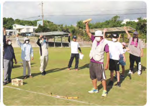
《各コート優勝チーム》