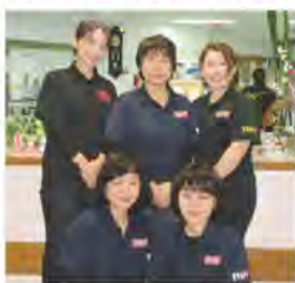
小谷園 こやの 居 い 宅 たく 介 かい 護 ご 支 し 援 えん セ せ ン ん ター 介 かい 護 ご 支 し 援 えん 専 せん 門 もん 員 いん の の 皆 みな さ ん