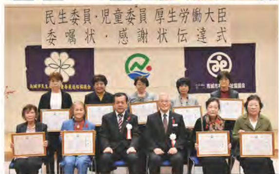
退任者の皆様、お疲れ様でした