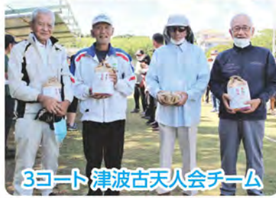
3コート 津波古天人会チーム