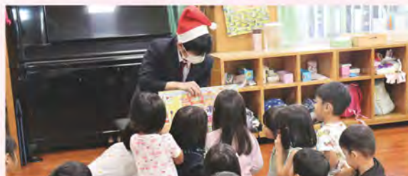
バンビ保育園との交流会の様子