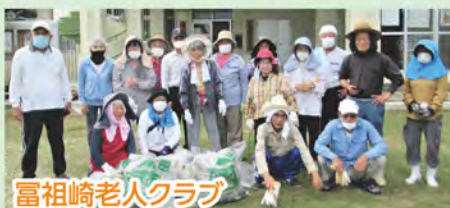
富祖崎老人クラブ