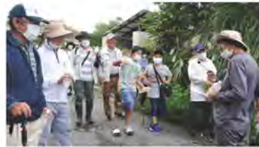
多くの子ども達や知名区民が参加