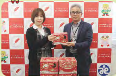
▲ 株式会社アサヒプラント様 クリスマスケーキ(100個)寄贈 市内子どもの居場所等へ