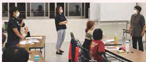
参加者の質問の様子