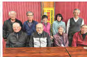
和やかな雰囲気の中で