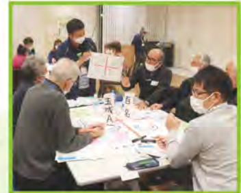
(2/7) 玉城地域 参加者 50名