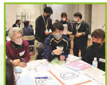
(1/31) 大里地域 参加者 70名