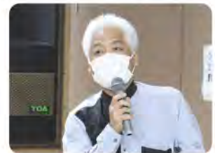
つきしろ自治会 上原副会長