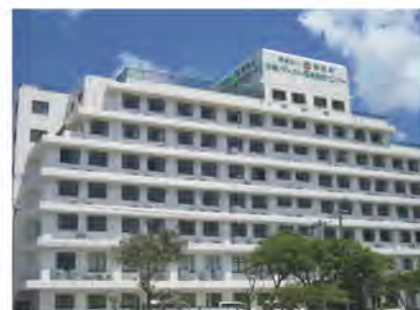
沖縄メディカル福祉総合センター