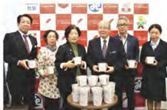
JA大里女性部様よりお味噌寄贈