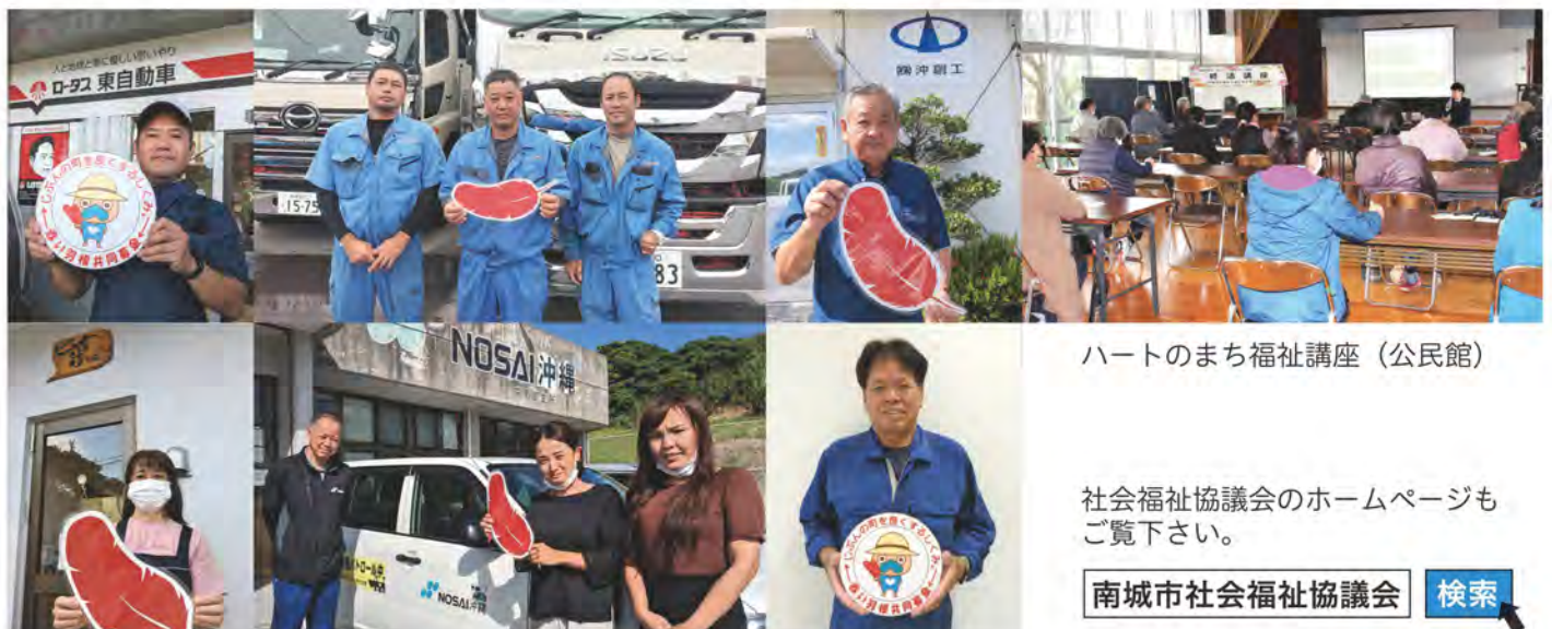
ハートのまち福祉講座 (公民館)