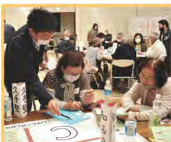
(2/1) 知念地域 参加者 45名