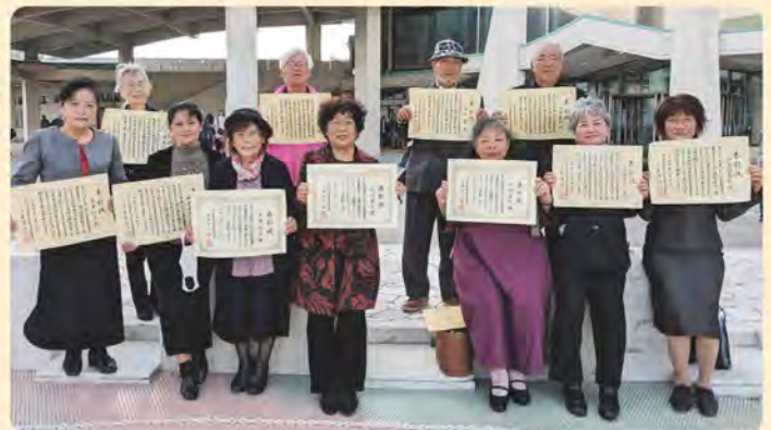
沖縄コンベンションセンター

長年にわたり、地域の見守り・良き相談役として尽力された功績に対し、県民生委員大会において、16名の皆さんが永年勤続者表彰(伝達)を受賞されました。おめでとうございます。