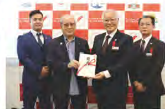
大成ホーム様より