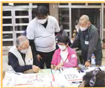
(2/8) 佐敷地域 参加者 45名