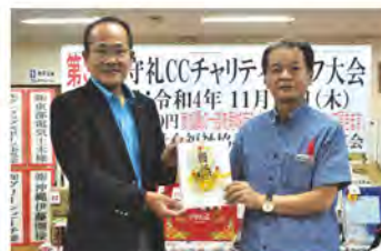
守礼カントリークラブ様より