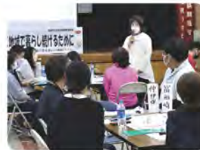
グループワーク報告