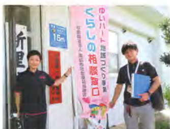
くらしの相談窓口 (公民館)