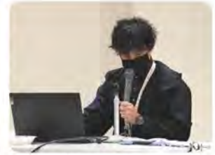
社協地域福祉 コーディネーター

参加した皆さんからは、「他地域の取組を知ることができ勉強（刺激）になった」「単発で終わらないで、次回も参加したいです」「この様な会を自治会でも実施してほしい」などの声が寄せられました。