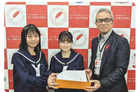
大里中学校より学童募金の贈呈(3/10)