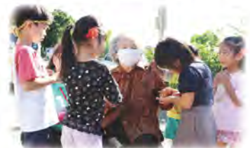
ちびっ子見守り隊 (パンピ保育園)