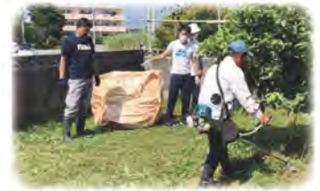
地域の方で高齢者宅を草刈り(嶺井団地区)