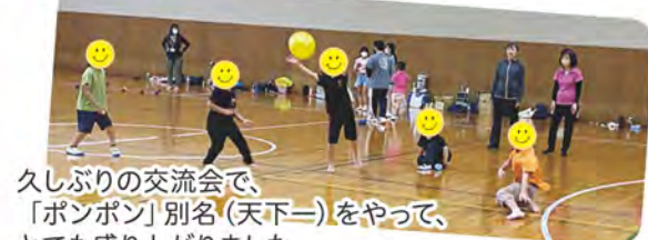
久しぶりの交流会で、「ボンボン」別名(天下一)をやって、とても盛り上がりました。