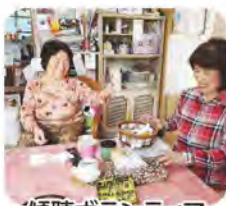
傾聴ボランティア