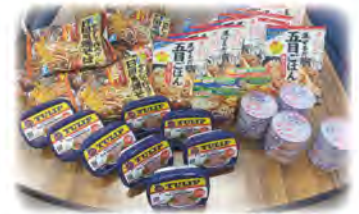
つながるフード寄贈品