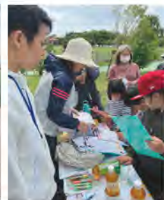
クイズの答え合わせ！ みんな大正解～