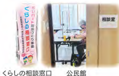
くらしの相談窓口 公民館

地域の身近な相談相手として活動する民生委員・児童委員と連携し、地域福祉の推進に取り組みます。(事務局運営)