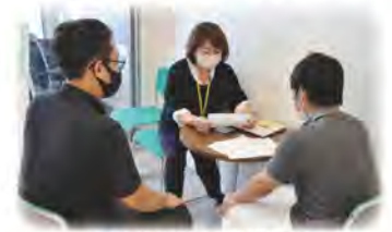
日常生活自立支援事業