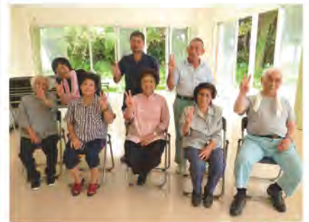
西原ミニデイのメンバーさんと

最近、同僚児童委員を通じて「仕事」が舞い込みました。それは不登校の子どもを持つ親が立ち上げたフリースペースの場所と時間を広げるお手伝いです。大里南北児童館の使用時間を広げられ、既に使われている島袋区コミュニティセンターに加え、西原区大里城址公園体験交流センターが使えるようになりました。学校以外の公共の場所に、不登校の子ども達が気がねなく出てこれるような、居場所づくりのお手伝いができたらと思います。