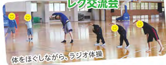
体をほぐしながら、ラジオ体操