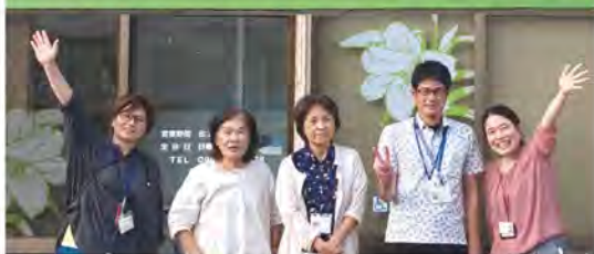
私達が相談を受けま～す。

令和4年4月に、「南城市地域包括支援センターしらゆり」をオープンし早一年が過ぎました。包括しらゆりは佐敷津波古にあり、高齢者やご家族の方々の総合相談窓口になります。今後ますます地域に根ざした関わりができるよう職員一同つとめていきたいと思えます。