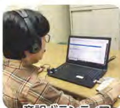
音訳ボランティア