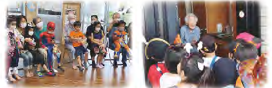
のびるっ子保育園 交流会&訪問

認知症、知的・精神障がいなどで、判断能力が不十分な方が、地域で自立した生活が営めるよう、契約により福祉サービスの利用や日常的な金銭管理などを支援します。