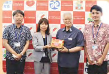
▲ ろうきん与那原支店様(4/24)