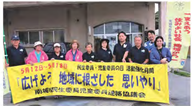
5月は「民生委員・児童委員活動強化月間」です。