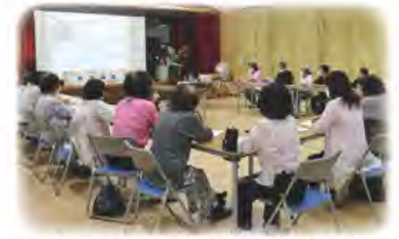
ゆいハート福祉講座（知名区）