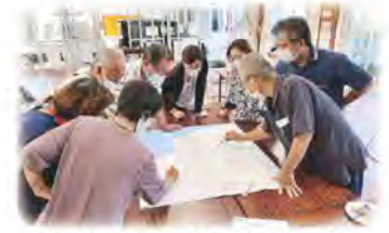
支え合い委員会（仲伊保区）