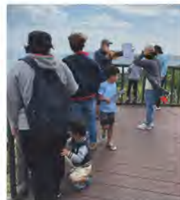
ここがどのような場所 だったのか歴史を紐とく