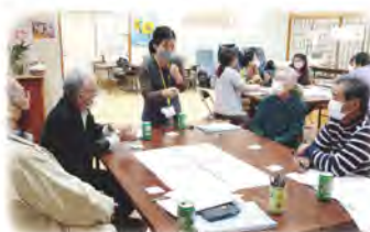
支え合い委員会 (グリーンタウン)