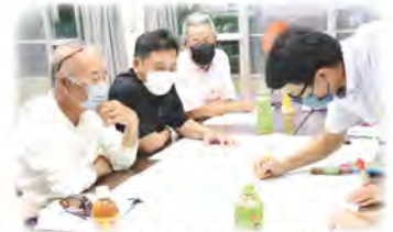
支え合い委員会 (大城区)