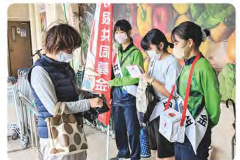
佐敷中学校による街頭募金運動(2/25)