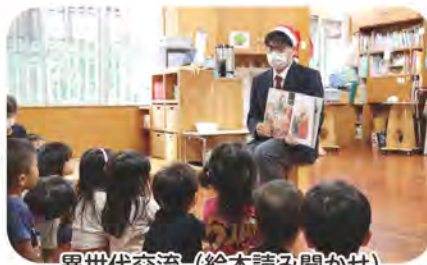
異世代交流(絵本読み聞かせ)