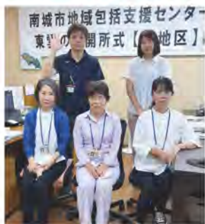
笑顔でお待ちしております。 お気軽にご相談下さい

これまで市役所内に設置されていた地域包括支援センターが、より充実した支援を行うため「地域型包括支援センター」として東西にエリアを分け「南城市地域包括支援セン