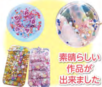
素晴らしい 作品が 出来ました