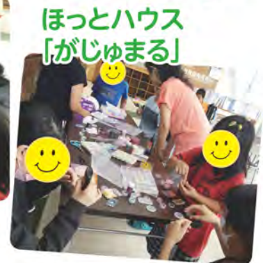
ほっとハウス 「がじゅまる」