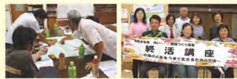
地域支え合い委員会 ハートのまち福祉講座 くらしの相談窓口