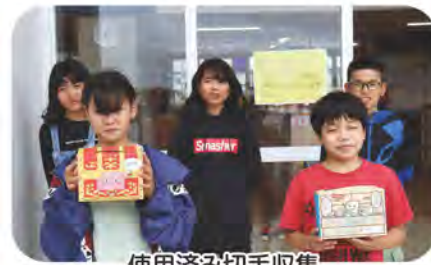
使用済み切手収集