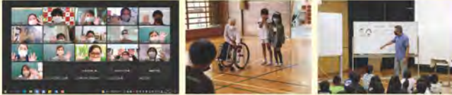
ボランティア連絡会 障がい者スポーツ交流 民生委員とは(小学校)