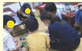
大学生ボランティア