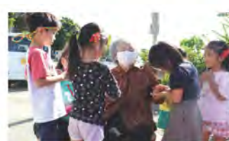
パンピ保育園ちびっこ見守り隊