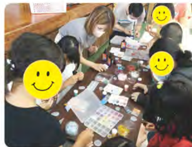
子ども達は学生ボランティア(コン ソーシアム沖縄)さんと一緒にレジ キーマーカーのデコレーションを考え ながら楽しく作っていました。