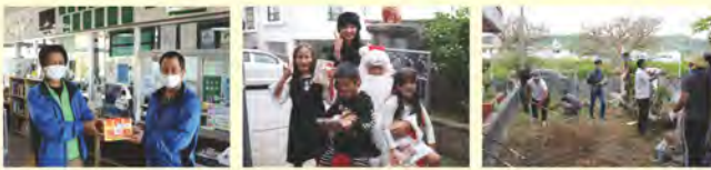
使用済み切手「回収箱」 絵本の配布 お掃除ボランティア