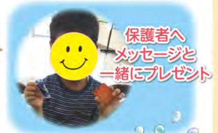
保護者へ メッセージと 一緒にプレゼント