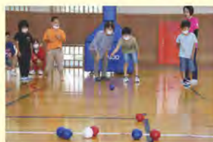
ほっとハウスレク交流会