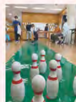
地活センター「野の花」