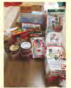
「自宅療養者」食料支援