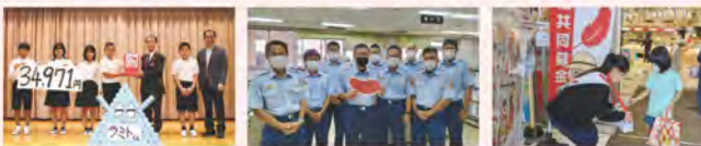
学童募金 職域募金 街頭募金