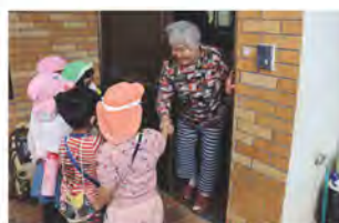
松の実保育園ちびっこ見守り隊