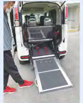
車イスのまま乗降できる車両の使用方法を懇切丁寧に教えてもらう

今後も連絡会では、地域の生活課題の把握につとめ、法人や団体の持つ資源を活かして、市民の持つ課題の解決に向けた取り組みを進めていきます。