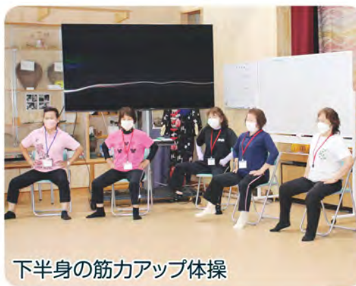
下半身の筋力アップ体操