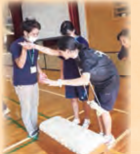
サポートはいつ?どのように?

バリアフリーや介助の重要性を学び、実際に久高のおじい・おばあにできることはないか?と考えるきっかけになったと思います。