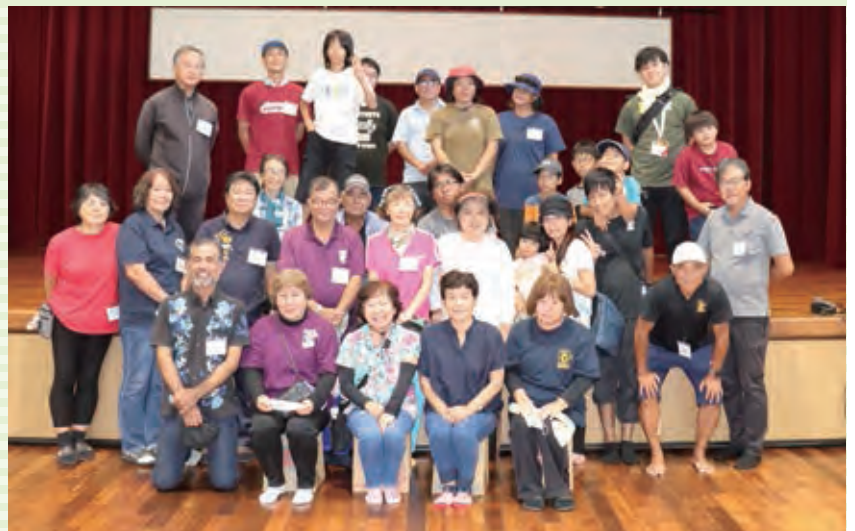
参加者のみなさんお疲れさまでした!