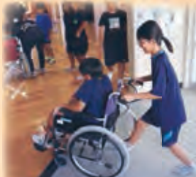
車いす操作に悪戦苦闘

9月27日(水)に久高小中学校で「高齢者疑似・車いす体験」が行われました。車いすで段差を乗り越えたり、90歳になった時を想定して、中腰の姿勢で普段生活している学校の中を歩く体験を行いました。