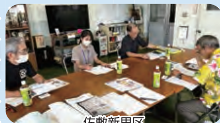
佐敷新里区 地域支え合い委員会

南城市社会福祉協議会での実習を通して、地域に出向き、地域住民と関わっていくことで、地域住民との信頼関係や地域での課題を発見していることを学びました。また、地域課題への対応は、ケースによって、異なるため、様々な機関を知っておくこと、多機関と連携し、住民の状況を把握することが重要になってくるということを学びました。さらに、近隣住民同士の繋がりの大切さ、地域住民同士の関わり場の大切さを学ぶことができました。