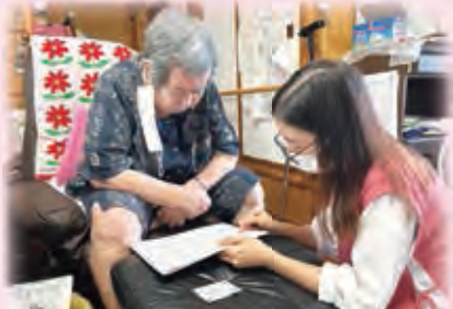
工工四を見ながら「安里屋ユンタ」を歌う