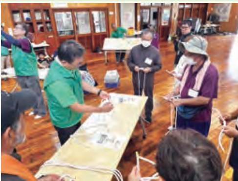
外れないロープの結び方を教わりました!