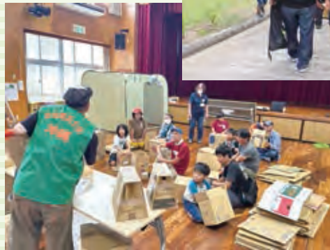
段ボールを使って避難所で役立つ椅子づくり