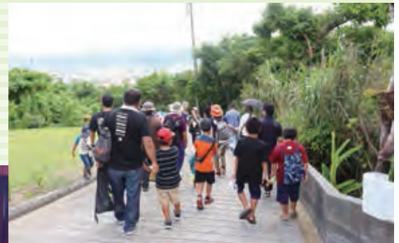
徒歩で避難経路の確認