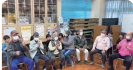
「幸せなら手をたたこう」の歌に合わせて