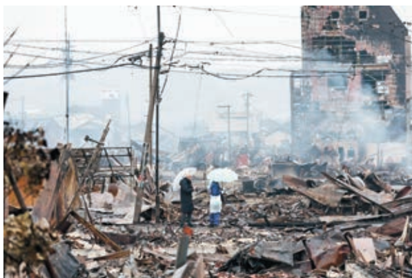
火災で一面焼け野原になった「輪島朝市」周辺

〒901-1412 沖縄県南城市佐敷字新里1870番地 (南城市役所庁舎内) ☎(098) 917-5692 (代表) / FAX 917-5694 URL: https://www.nanjo-shakyo.com