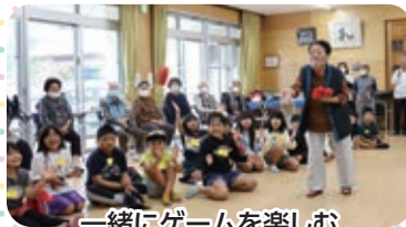
一緒にゲームを楽しむ