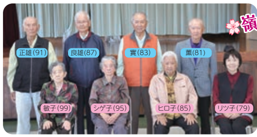
嶺井兄弟姉妹 8名全員集合

今回の訪問記は、幾つになっても仲睦まじい字當山の嶺井兄弟姉妹をご紹介します。 戦世を乗り越え、戦後78年!全員が集まるのは久々で互いの体調を気に掛け合う様子は離れていても心はひとつ、兄や姉を敬い「ケンカはしない」と話す最高にステキな兄弟姉妹です。