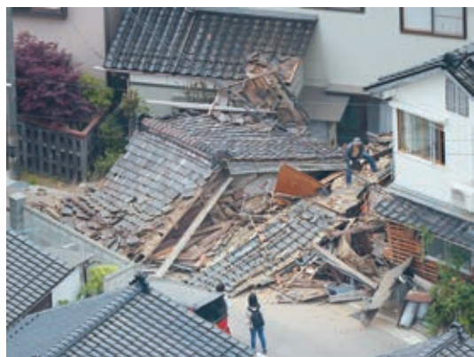
石川・珠洲で建物倒壊