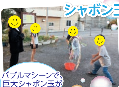
バブルマシンで、巨大シャボン玉が出来たあ