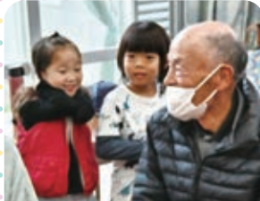
思わず顔がほころびます

2/8(木)輝咲保育園の園児が稲福のミニデイ、2/16(金)知念小学校3年生が知名のミニデイを訪問、異世代間の交流を実施しました。