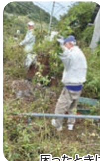
困ったときはお互い様! 互助のマンパラー