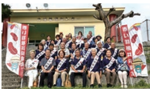
奉仕員による事業所まわり (大里地域)