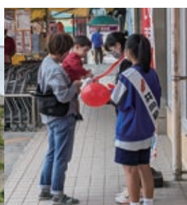
アトールにて街頭募金 (大里中の生徒が協力)