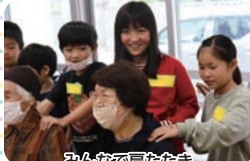
みんなでおんたたく

それぞれ地域のおじい、おばあにミニゲームをして楽しみました。おじい、おばあは目を輝かせ、終始笑顔で園児や児童との貴重な時間を過ごしました。