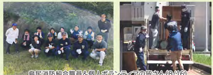
島尻消防組合職員&個人ボランティアの皆さん(8/16)

今回、快くボランティア活動にご協力頂いた皆様へ感謝申し上げます。ありがとうございました。