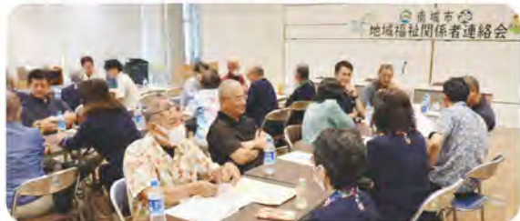
佐敷・大里地域連絡会 (6/5)