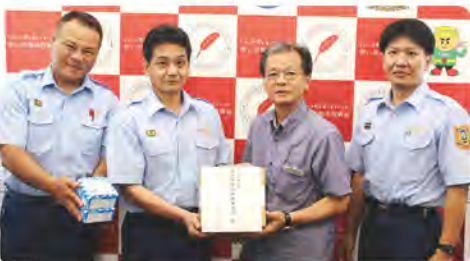
島尻消防組合消防本部 様(7/19) 独居高齢者世帯等へ火災報知機の寄贈(21個)