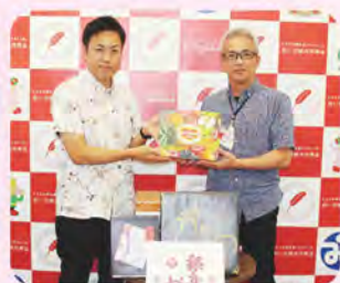
街クリーン株式会社様より 食料品寄贈(8/15)

〒901-1412 沖縄県南城市佐数字新里1870番地 (南城市役所庁舎内) ☎(098) 917-5692 (代表) / FAX 917-5694 URL: https://www.nanjo-shakyo.com