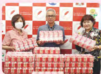
沖縄ヤクルト株式会社様より ヤクルト4,660本寄贈(7/30)