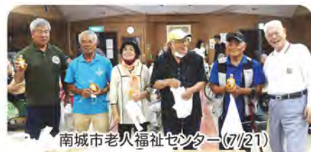
南城市老人福祉センター(7/21)

豊見城市・南風原町・与那原町・西原町・中城村・南城市の身障協が一堂に集い、スポーツレクリエーションを通して相互の連携・親睦を深めました。 今回主催した南城市、オリジナル競技の三角ボードが大盛況、終始笑顔で笑いの絶えない交流会となりました。