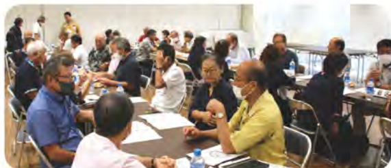
知念・玉城地域連絡会 (7/5)

地域住民の身近な相談役である民生委員・児童委員と、地域の代表である区長・自治会長、また地域福祉推進の役割を担うべき社会福祉協議会・関係行政機関等が一堂に集まり『地域福祉関係者連絡会』を開催しました。